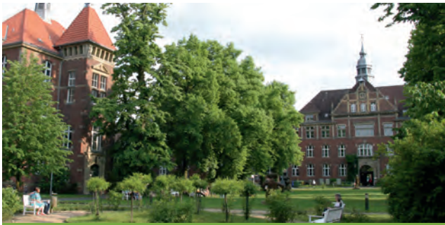
DRK Kliniken Berlin I Westend

Spandauer Damm 130 14050 Berlin-Charlottenburg-Wilmersdorf