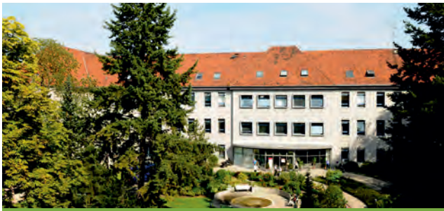
Jüdisches Krankenhaus Berlin

Heinz-Galinski-Straße 1 13347 Berlin-Mitte