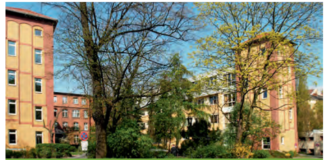
Evangelische Elisabeth Klinik