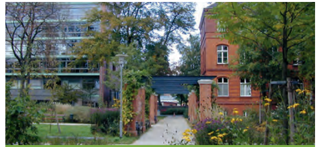
Vivantes – Klinikum Spandau