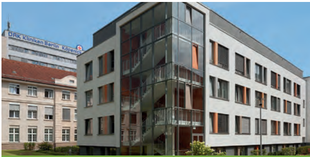
DRK Kliniken Berlin I Köpenick

Salvador-Allende-Straße 2 - 8 12559 Berlin-Treptow-Köpenick