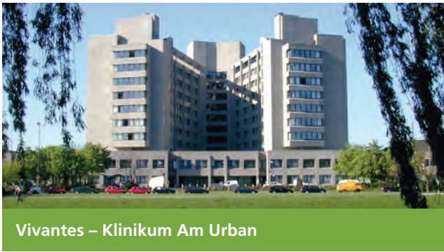
Vivantes – Klinikum Am Urban

Dieffenbachstraße 1 10967 Berlin-Friedrichshain-Kreuzberg