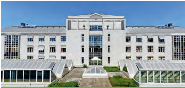
Vivantes – Auguste-Viktoria-Klinikum

Rubensstraße 125 12157 Berlin-Tempelhof-Schöneberg