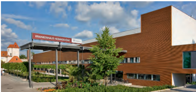
Alexianer St. Hedwig-Kliniken Berlin – Krankenhaus Hedwigshöhe

Höhensteig 1 12526 Berlin-Treptow-Köpenick