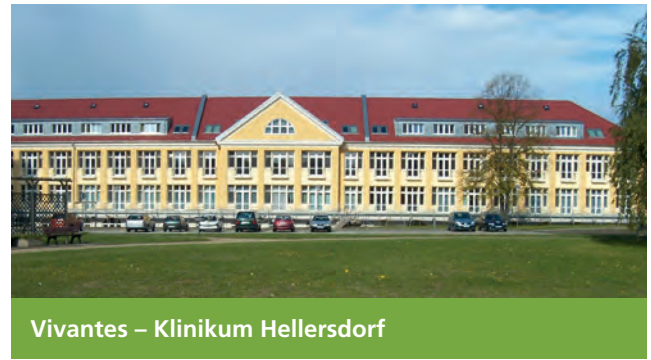
Vivantes – Klinikum Hellersdorf