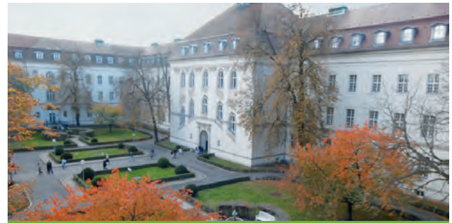
Deutsches Herzzentrum Berlin