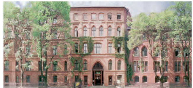
Alexianer St. Hedwig-Kliniken Berlin – St. Hedwig-Krankenhaus