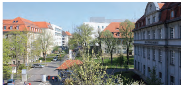
Sana Klinikum Lichtenberg