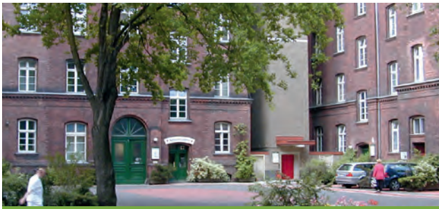
Vivantes – Klinikum Prenzlauer Berg