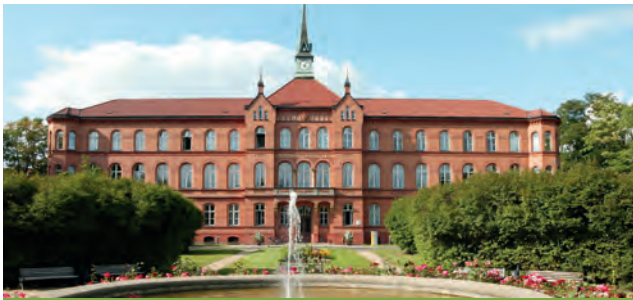
Evangelisches Krankenhaus Königin Elisabeth Herzberge

Herzbergstraße 79 10365 Berlin-Lichtenberg