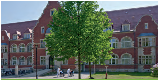
Evangelische Lungenklinik Berlin