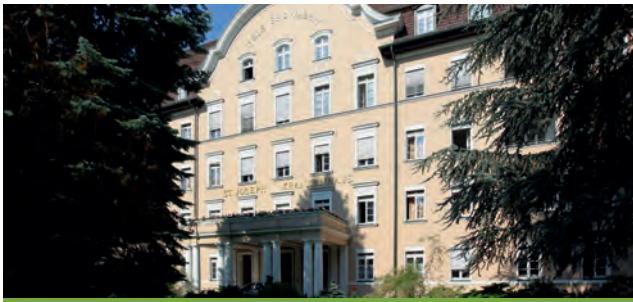
St. Joseph Krankenhaus Berlin Tempelhof

Wüsthoffstraße 15 12101 Berlin-Tempelhof-Schöneberg