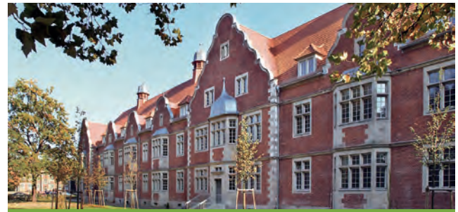
Immanuel Krankenhaus Berlin (Berlin-Buch)