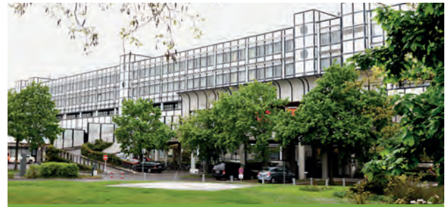
Vivantes – Klinikum Neukölln