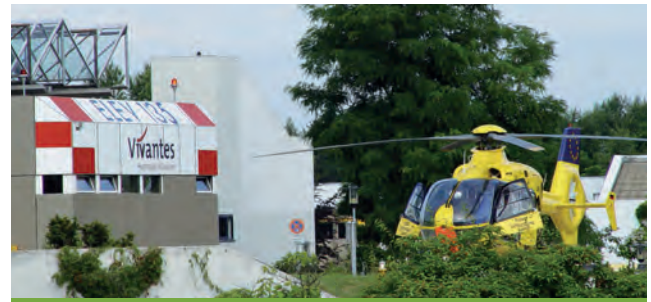
Vivantes – Humboldt-Klinikum