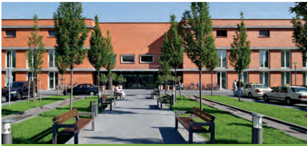
Vivantes – Klinikum im Friedrichshain

Landsberger Allee 49 10249 Berlin-Friedrichshain-Kreuzberg