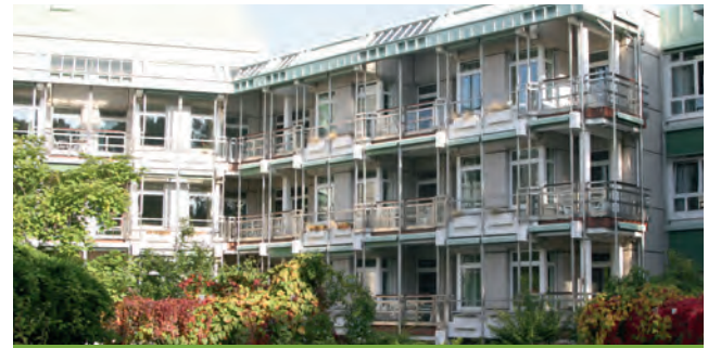
Evangelisches Krankenhaus Hubertus