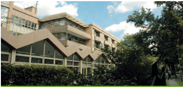
Immanuel Krankenhaus Berlin (Berlin-Wannsee)

Königstraße 63 14109 Berlin-Steglitz-Zehlendorf